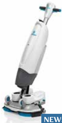
NEW: I-MOP LIGHT